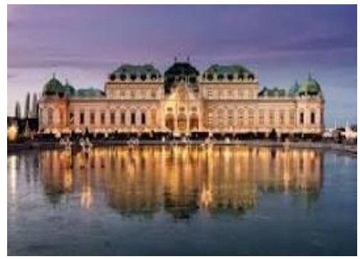
Schloss Belvedere Wien

Der britische Film von Simon Curtis erzählt die wahre Geschichte der Wiener Jüdin Maria Altmann, die in die USA emigrierte. Ihre Familie war im Besitz von Gemälden von Gustav Klimt, die von den Nationalsozialisten beschlagnahmt wurden. In einem Justizkrimi führt sie einen Kampf um Restitution von Nazi Raubkunst, Recht und Gerechtigkeit. Dieser Film beeindruckt durch starke schauspielerische Leistungen und hält die Waage zwischen Drama und Komödie.